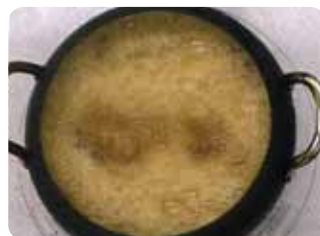
消えにくい泡(カニ泡)

揚げ油を繰り返し使うと、徐々に泡が消えにくくなり、食材を取り去った後もしばらく泡が残ります。さらに使い続けると揚げている食材が見えなくなるほどの泡(カニ泡)ができます。