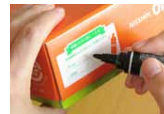
日清オイリオギフトは、賞味期限のメモ欄があります。

押し入れや物置などに、頂き物の油が保存されていませんか。賞味期限が過ぎないように、ときどきチェックしてください。